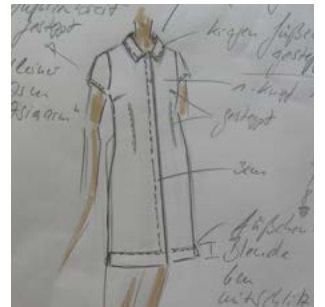
Kollektion Berlin - Neukölln Kleid „Braunschweiger“