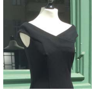
Kollektion Berlin - Neukölln Jerseykleid „Sonnenallee“