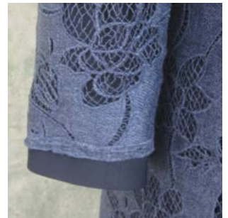
Kollektion Berlin - Neukölln Mantel „Heidelberger“