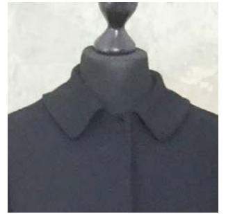
Kollektion Berlin - Neukölln Jerseymantel „Wildenbruch“