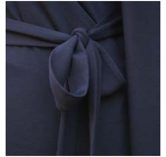
Kollektion Berlin - Schöneberg Jersey Wickelkleid „Merseburger“