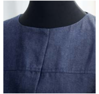
Kollektion Berlin - Schöneberg Jeansmantel „Winterfeld“